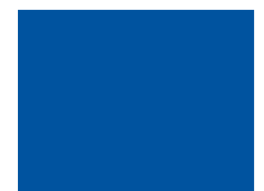
Sköld och bakgrund i Kavajmärke